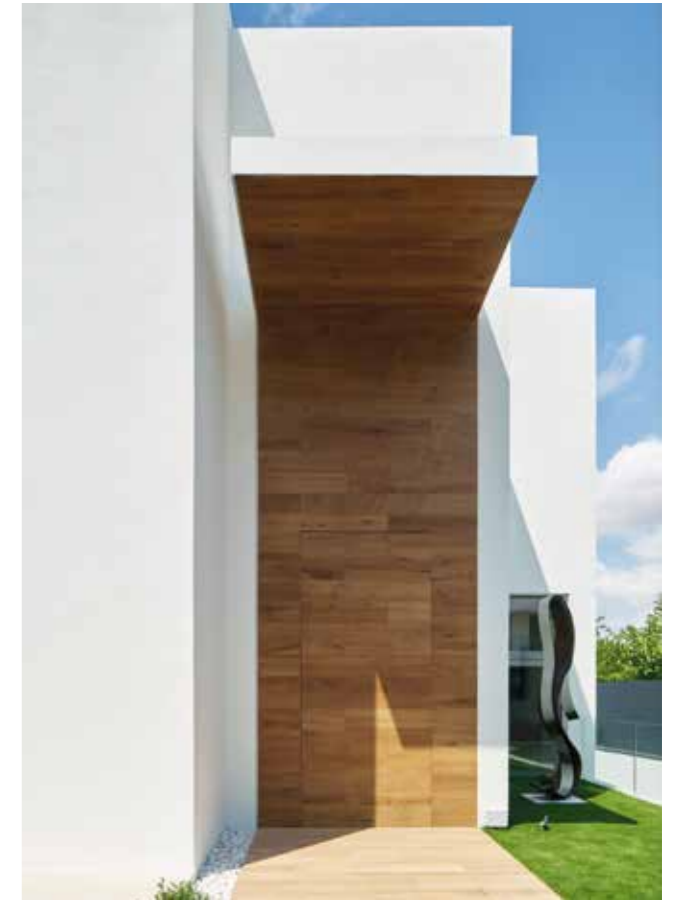
TEXTOS: ADA MARQUÉS.

que la rodea. Los pavimentos exteriores son el modelo Bottega Caliza Nature y Ascot Arce, y la fachada es de Porcelanosa, modelo Ascot Teka.